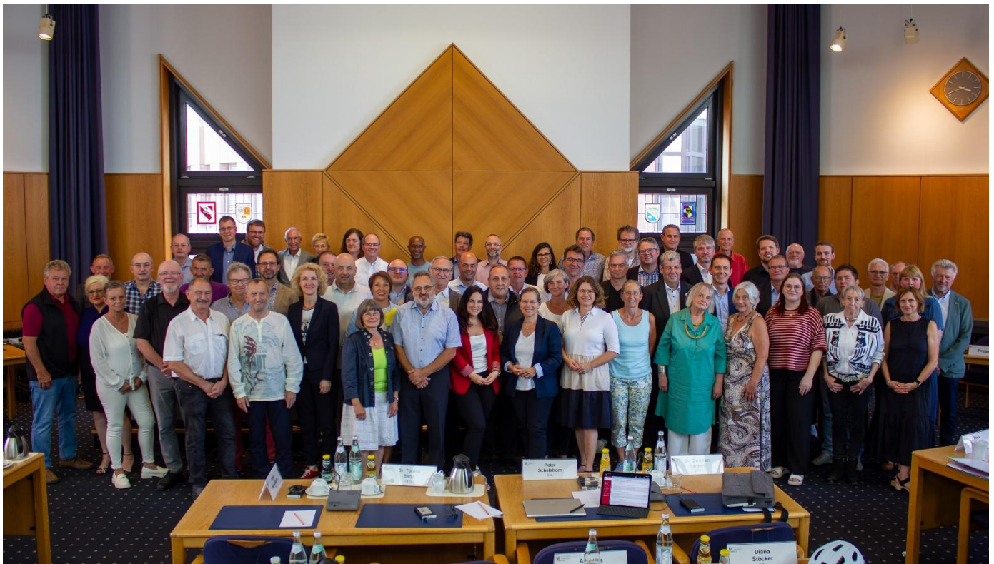
Kreistag zum Zeitpunkt der Konstituierung am 24.07.2024

Beschließende Ausschüsse, Vertreterinnen / Vertreter in Organen anderer juristischer Personen, sonstige Gremien