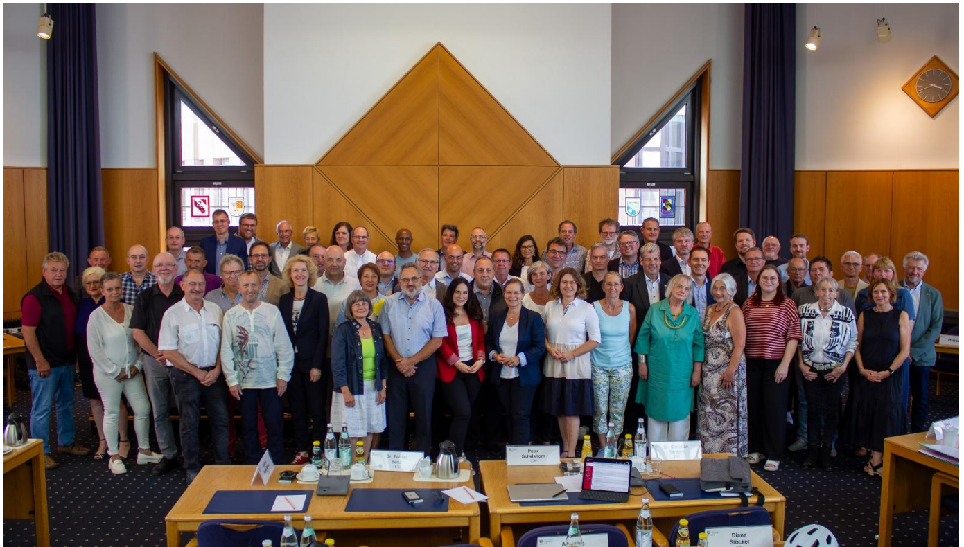
Kreistag zum Zeitpunkt der Konstituierung am 09.06.2024

Beschließende Ausschüsse, Vertreterinnen / Vertreter in Organen anderer juristischer Personen, sonstige Gremien