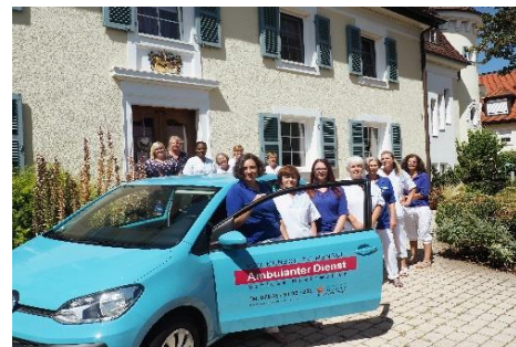
Ambulanter Dienst Schloss Rheinweiler