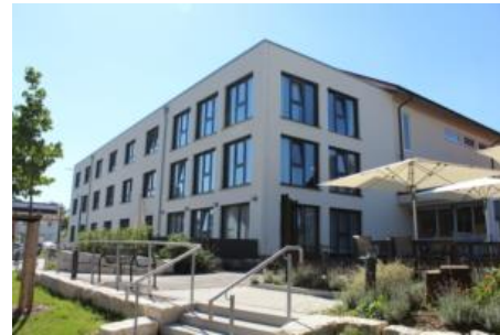
Pflegeheim Markgräflerland Weil am Rhein