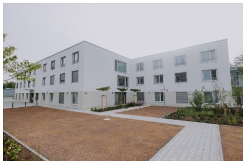
Haus am Sonnenstück Schliengen