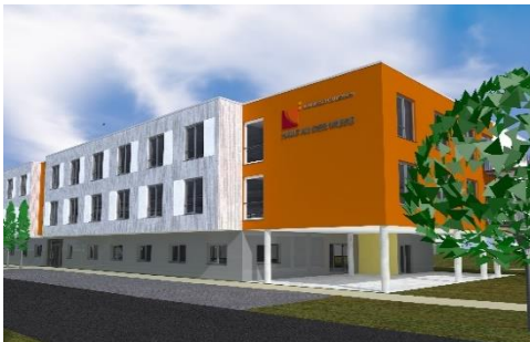
Haus an der Wiese, Hausen im Wiesental