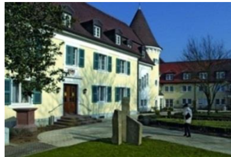
Pflegeheim Schloss Rheinweiler