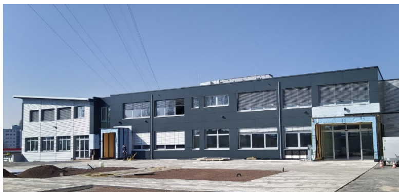
Neubau und Eingang Gewerbeschule Rheinfelden

Verbesserungen im Ergebnis gab es durch die um 685.000 EUR höheren Schulbaufördermittel für die GWS Schopfheim und die GWS Rheinfelden. Außerdem konnten keine gesonderten Maßnahmen für die Errichtung und Ausstattung von Differenzierungsräumen an den Schulen ergriffen werden und das geplante Öffentlichkeitskonzept konnte nur in kleinem Umfang umgesetzt werden. Einzelheiten zu den Maßnahmen und den Kosten können der Übersicht auf der nachfolgenden Doppelseite entnommen werden