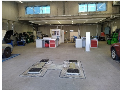
Gewerbeschule Rheinfelden – Neueinrichtung der berufsvorbereitenden Werkstätten

Außerhalb des RSE-Prozesses wurden die Holz- und die metallverarbeitenden Werkstätten für die Berufsvorbereitung an der Gewerbeschule Rheinfelden neu eingerichtet. Während der Bauphase des Neubaus waren die beiden Werkstätten vorübergehend im Untergeschoß des Hauptgebäudes untergebracht gewesen. Im Sommer 2021 war der Neubau so weit fertiggestellt, dass diese Werkstätten in die modernisierten Räumlichkeiten zurückverlegt werden konnten.